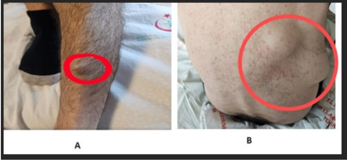
A- sol alt ekstremite ekstensor yüzeyde gelişen subkutanöz nodüler metastatik lezyon ve B- Sırt bölgesinde metastatik nodüler lezyonlar